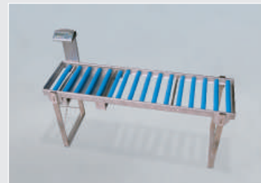
Bascule de transporteur à rouleaux