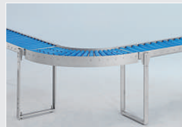
Courbe de transporteur à rouleau 90°