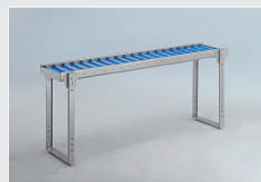
Transporteur à rouleaux