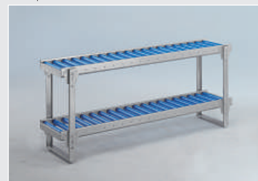
Tweevoudige transportband op twee niveaus