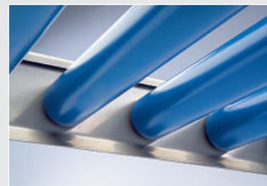
Geen vuilafzetting mogelijk

Neem contact met ons op. Wij ontwerpen een goederenstroom voor u.