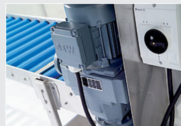
Velocità regolabile con variatore